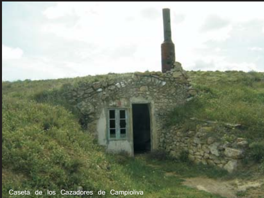
Caseta de los Cazadores de Campioliva