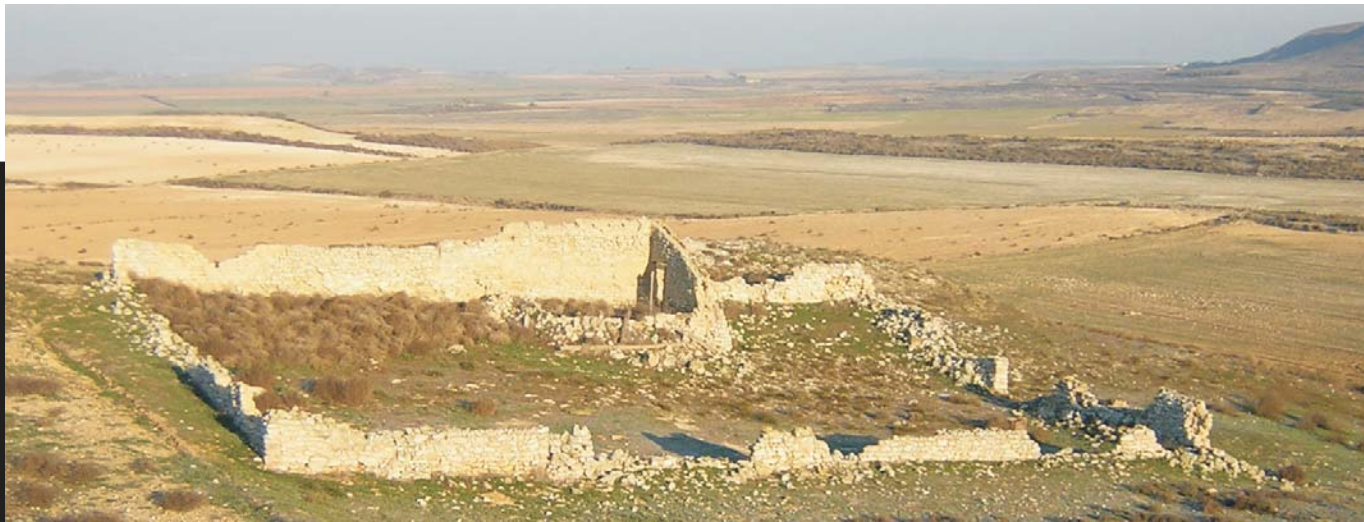
Corral de Catalán de Carbonera

Su empleo como lugar de resguardo para el ganado ovino y caprino se traduce en una característica organización interna a partir de una parte cubierta, otra descubierta y, frecuentemente, una caseta como lugar de habitación con hogar para los pastores (aunque también fuera usada habitualmente por labradores). Algunos tienen un caño como sustitución o apoyo a la caseta pastoril. Todos ellos poseen una planta rectangular en la que los cubiertos suelen situarse en su lado occidental abriendo por tanto hacia el raso en una orientación Este o Sureste. Tampoco es raro que el propio descubierto esté dividido en dos o cuatro fragmentos así como que la caseta del pastor se sitúe integrada en el muro del raso situado frente al cubierto y, por tanto, en el lado Este o Sureste del conjunto. Son de un tamaño regular aunque unos pocos son claramente más pequeños.