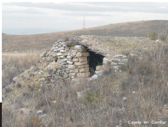
Caseta en Cerrillar

-El grupo más numeroso con unos treinta ejemplos es el de las casetas semiexcavadas o excavadas completamente en el terreno, con muros a base de mampostería y cubierta vegetal a dos aguas y con poca pendiente, compuesta únicamente de cañas y con tierra por encima. Ocupan una franja de terreno intermedia en la zona de monte y, por su tamaño más bien pequeño, parece que eran usadas de manera preferente como refugio ocasional. En la mayor parte de los casos solo queda testimonio de la excavación del terreno por lo que habrá que tomar con precaución su adscripción definitiva a esta tipología de casetas. Solo cinco ejemplos conservan en un estado relativamente aceptable la cubierta vegetal.