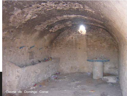
Caseta de Domingo Corral