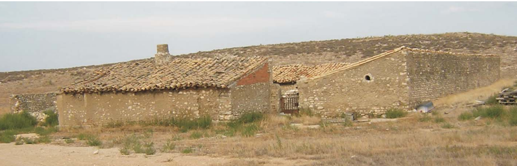
Corral de La Pica