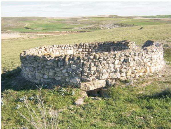
Balsete del Corral de Bizcochea