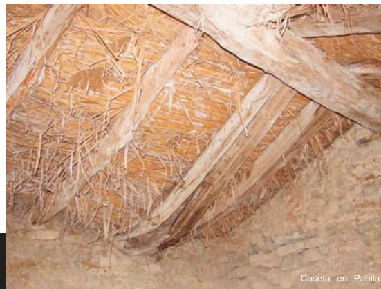
Caseta en Pabla