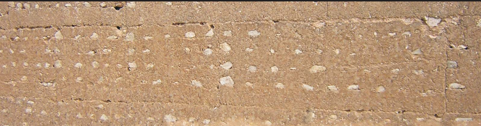
Corral de Bizcochea