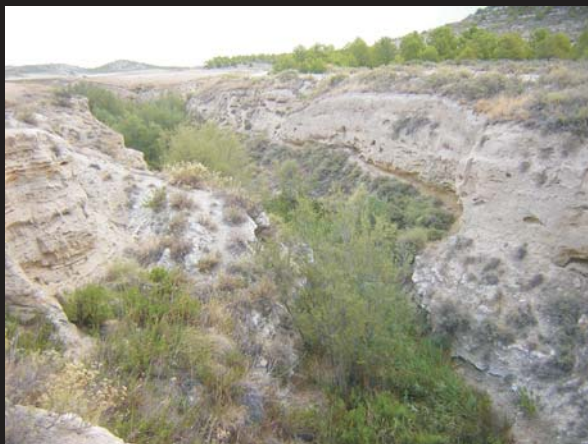
Barranco de Las Casas

En cuanto a los cambios que se fueron produciendo en la intervención humana sobre este paisaje no contamos todavía con suficientes estudios históricos o socioeconómicos publicados como para pasar de unas meras líneas generales. En general, para la sociedad tradicional en la que floreció la construcción de la mayor parte de los elementos conservados en el monte de Villamayor, la tierra y su trabajo fue prácticamente la única fuente de riqueza durante muchos siglos. También fue muy importante la actividad ganadera aunque a partir del siglo XIX fue decayendo con el fin de la trashumancia y la desamortización de los bienes comunales, lo que conllevó un aumento de la superficie roturada que, a su vez, parece ir de la mano del crecimiento poblacional que registra el medio rural de manera genérica a finales del siglo XIX y comienzos del XX. Esta evolución en los usos del monte pudo conllevar un primer abandono de infraestructuras ganaderas y un momento puntual de nueva creación de estructuras de apoyo a las faenas agrícolas a lo largo del siglo XIX, que confluyó asimismo en una fuerte presión sobre la vegetación existente.