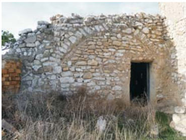
Caseta con bóveda en el Corral de Inacio o del Donao