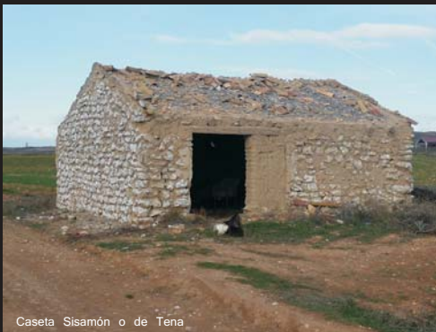
Caseta Sisamón o de Tena