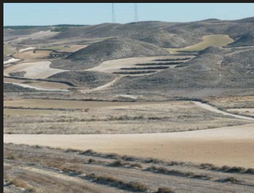
Corraliza de San Juan