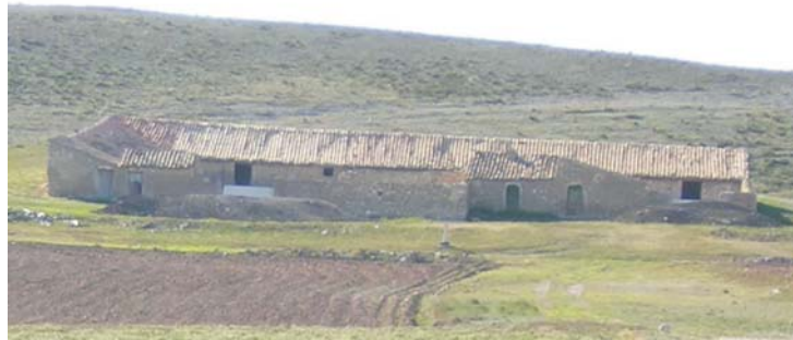
Corral de Bizcochea

El estado de conservación de estos corrales de fábrica tradicional es de avanzado deterioro, estando la mayor parte de ellos completamente abandonados por lo que solo dos ejemplos pueden considerarse que se conservan en un estado regular (Paridera de Bizcochea y Corral de la Pica) mientras el resto se encuentra en ruinas o completamente arrasados.