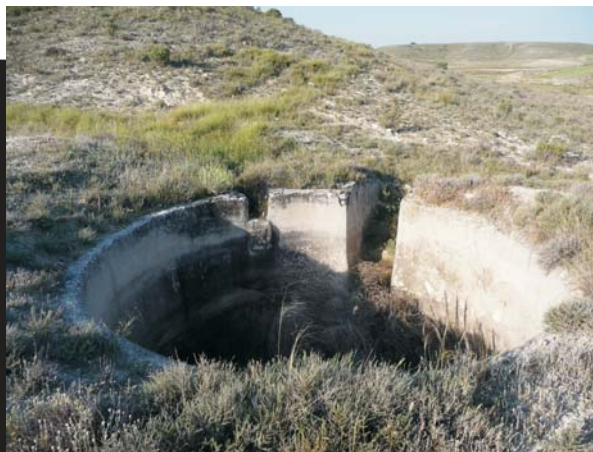
Balsete de Inacio