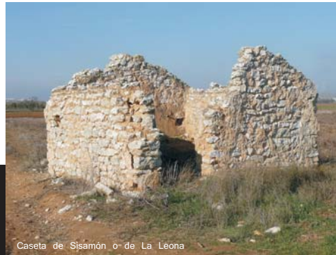
Caseta de Sisamón o de La Leona