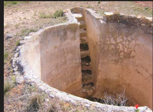
Balsete de Herederos de Campoliva