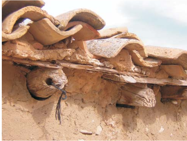
Corral de La Pica

Su fábrica siempre es de mampostería, salvo en el Corral de Bizcochea donde se aprecia el uso de un antiguo encofrado. Para su construcción se solía utilizar como materia prima aquellas piedras que se retiraban de los campos y se iban dejando en montones para facilitar las labores de cultivo. Los tejados de cubiertos y casetas estaban compuestos de maderos (que a veces bajaron por el Gállego en forma de almadías), cañizo y teja árabe.