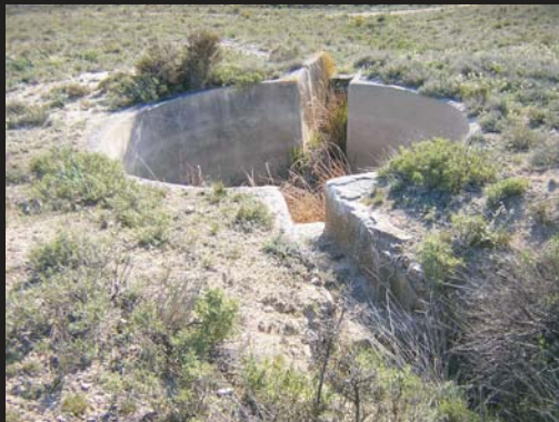
Balsete de Vicente Garcés

Una primera excepción son dos aljibes (uno de ellos de planta rectangular) completamente cubiertos en su cara superior, lo que recuerda los aljibes de otras zonas en las que resulta más común esta cubierta superior para mejorar la conservación de la calidad del agua. Una segunda excepción a este modelo son otros dos aljibes compuestos por un depósito enterrado de perfil abombado o en forma de vasija, uno de los cuales además resuelve su parte superior mediante un pretil que recuerda al de los conocidos aljibes de La Muela.