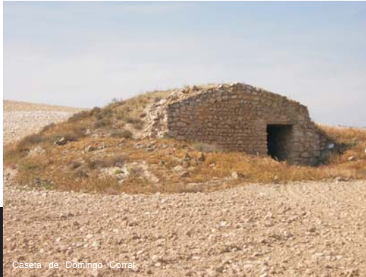
Caseta de Domingo Corral

Destaca entre ellas por su buen estado de conservación la caseta de Domingo Corral. Además, la Caseta Palú conserva unas interesantes inscripciones todavía visibles parcialmente.