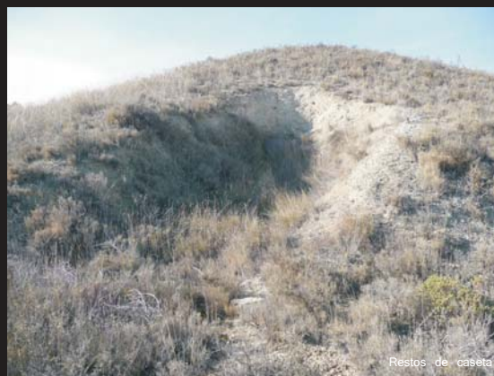
Restos de caseta