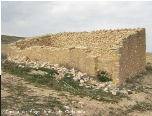
Caseta de Ángel Arraiz de Carbonera

-Una docena de ellas aparecen de manera claramente exenta, tienen planta rectangular, muros de mampostería y cubierta a una o dos vertientes con cañizos y tejas árabes completamente desaparecidas o expoliadas. El material con que se fabrican sus muros es caliza, o yeso en torno al camino de La Puebla, aunque de manera excepcional dos de ellas se levantaron a base de adobas. Se sitúan en zonas alejadas de la localidad y con grandes extensiones cultivables. Suelen contar con un pesebre en su interior y su función sería la de guardar aperos, proteger los animales de labor y servir de refugio para la pernocta temporal.