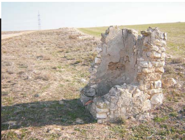
Balsete de Artigas en Carbonera