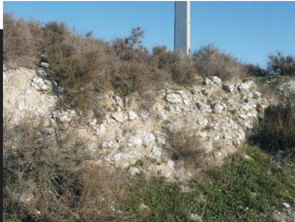
Pared de era

En él se distribuye un nutrido grupo de eras con paredes de sostenimiento que recuerdan las de las terrazas, unos pocos pajares en los que se guardaba el “alfalce” de la huerta, y sobre todo más de una decena de caños , nombre local con el que se conocen unas casetas de era semienterradas y con bóveda de piedras de yeso que se utilizaban para guardar el agua fresca y servir de refugio durante la dura faena estival de la trilla del cereal en las eras.